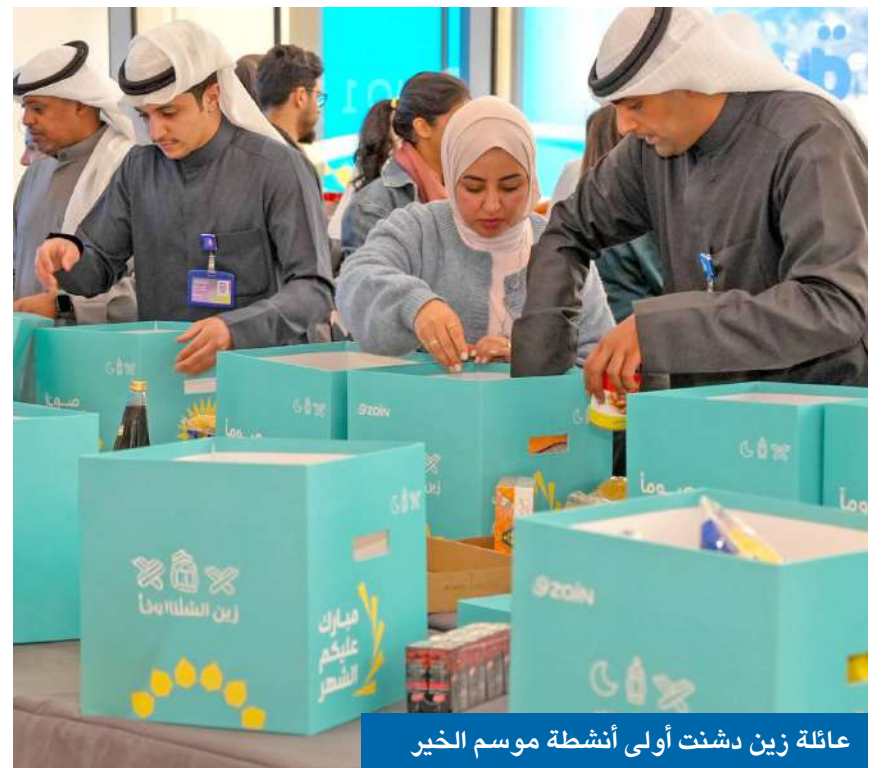
عائلة زين دشنت أولى أنشطة موسم الخير

روابط العطاء بين أفراد المجتمع خلال الشهر الفضيل. وتقوم زين من خلال حملة زين الشهور ترسيخ نهجها في الشراكة المجتمعية الفاعلة خلال الشهر الفضيل، عبر مبادرات متجددة تتوسع عاماً بعد عام بالتعاون مع مؤسسات الدولة والقطاع الإنساني، بما يعكس قيم العطاء والتكافل المتجذرة في المجتمع الكويتي.