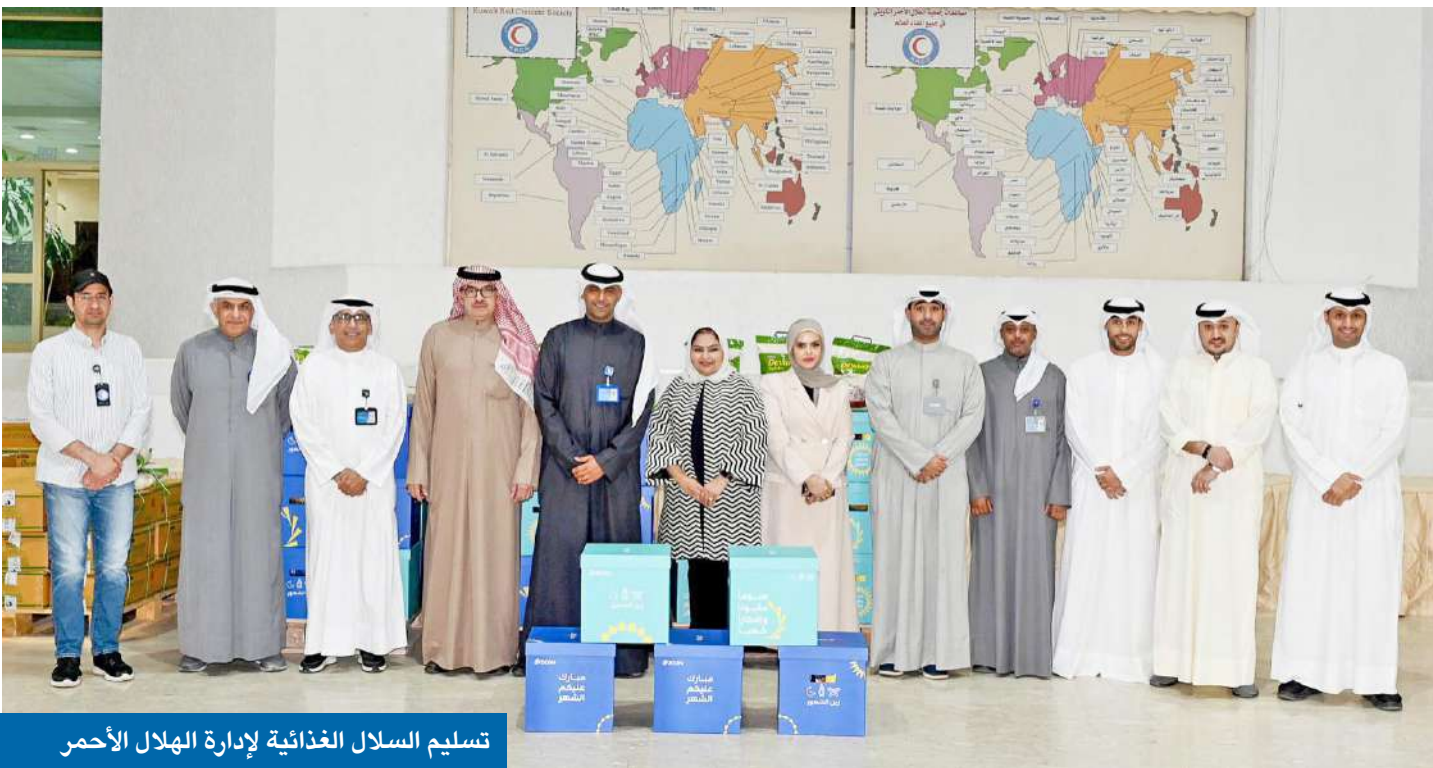
تسليم السلال الغذائية لإدارة الهلال الأحمر