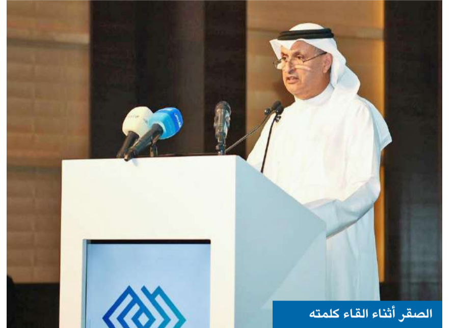
الصقر أثناء اللقاء كلمته

استراتيجية مهمة لتبادل الخبرات والرؤى وتعزيز الحوار بين الجهات المعنية بالتطوير العمراني والإسكان والاستثمار، بما يدعم جهود التنمية الشاملة في دولة الكويت.