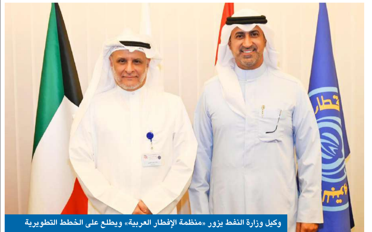
وكيل وزارة النفط يزور «منظمة الإفطار العربية»، ويطلع على الخطط التطويرية